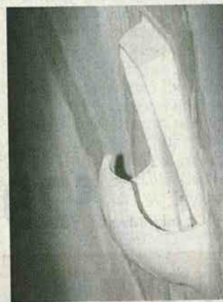
800 Schwalbennester leuchten in der Stadthalle.

Energiesparlampen werden die Wandleuchten demnächst tragen, verdeckte Lampenschirme werden das Licht streuen. Zudem werden die Schwalbennester individuell steuerbar. Insgesamt rechnen die Experten nach dem Umbau der Stadthalle mit einer Energieersparnis von 15 %. jös