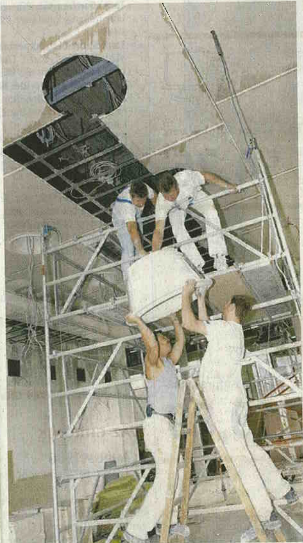
Das Haus wird, so die Planer, „Spielwiese für Lichtszenierungen“. Handwerker bauen derzeit das Spielgerät ein.

„Außer bei den Vorhängen werden wir uns mit Farben zurückhalten. Der Grundton ist weiß. Wir arbeiten mit Lichtfarben“, sagt der Stuttgarter. Wobei die Fülle schier unendlich scheint. „Theoretisch könnte man 16 Mio Farben generieren.“ Licht sorgt also in der neuen Stadthalle schon für ein Höchstmaß an Stimmungen, an Veränderungen. In